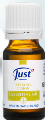
ULJE LIMUNA Prštave mirisne note i energizirajuća svojstva. 10 ml - Art. 3801