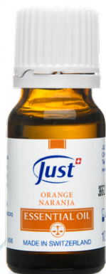
ULJE NARANČE Slatka nježnost i pozitivnost nadahnute plodovima Mediterana. 10 ml - Art. 3806