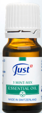
ULJE METVICE Sinergija metvice za pospešivanje koncentracije i svježine. 10 ml - Art. 3850