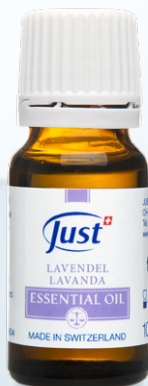
ULJE LAVANDE Sugestivne mirisne note koje prizivaju mir i vedrinu. 10 ml - Art. 3804