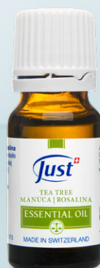
ULJE TEA TREE Visoko umirujuća i pročišćavajuća formula. 10 ml - Art. 3816